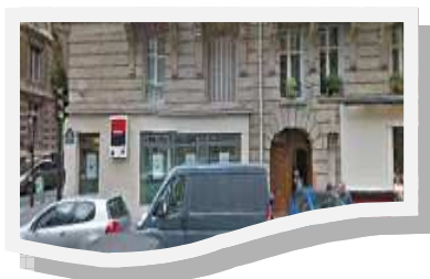
L'ancien site de l'école 28, rue d'Assas, Paris VIème

Oscar, le classique et incontournable squelette, en paraissait charmé ! On ne se battait pas pour exercer sur elle nos progrès en massage... de peur de l' user encore plus. Oui, ça peut paraître méchant, mais, de voir ce corps totalement nu sur la table, nous