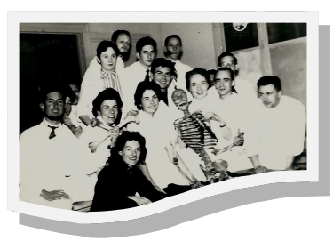
Les anciens de 1957 et Oscar le squelette