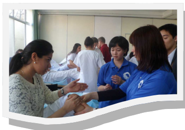
Accueil en février 2014 de la délégation d'étudiants japonais de Kobé